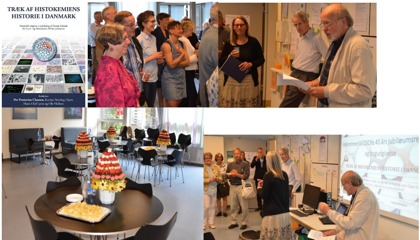
Billeder fra receptionen på Hvidovre Hospital.